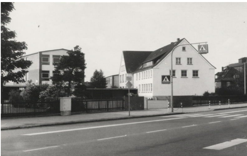
Dieses Foto ist zwar Anfang der 70er Jahre aufgenommen, aber so sah die Schule noch aus, als Herr Bramekamp nach Zeven kam.

Es gab nur den vorderen Teil des Hauses 1 und ebenfalls nur einen Teil des Hauses 2 (die Räume 204, 214 und 224 wurden später angebaut) sowie die Turnhalle. Auch die Pausenhalle existierte nicht.