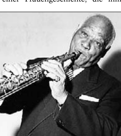
Sidney Bechet (1897-1959)

und macht eine Europa-Tour mit dem Southern Syncopated Orchestra von Will Marion Cook. In London legt er sich auch sein erstes Sopransaxophon zu und gibt eine Galavorstellung im Buckingham Palace. 1920 spielt er in Paris im Apollo in Montmartre und geht dann nach London, wo er wegen einer Frauengeschichte, die ihm