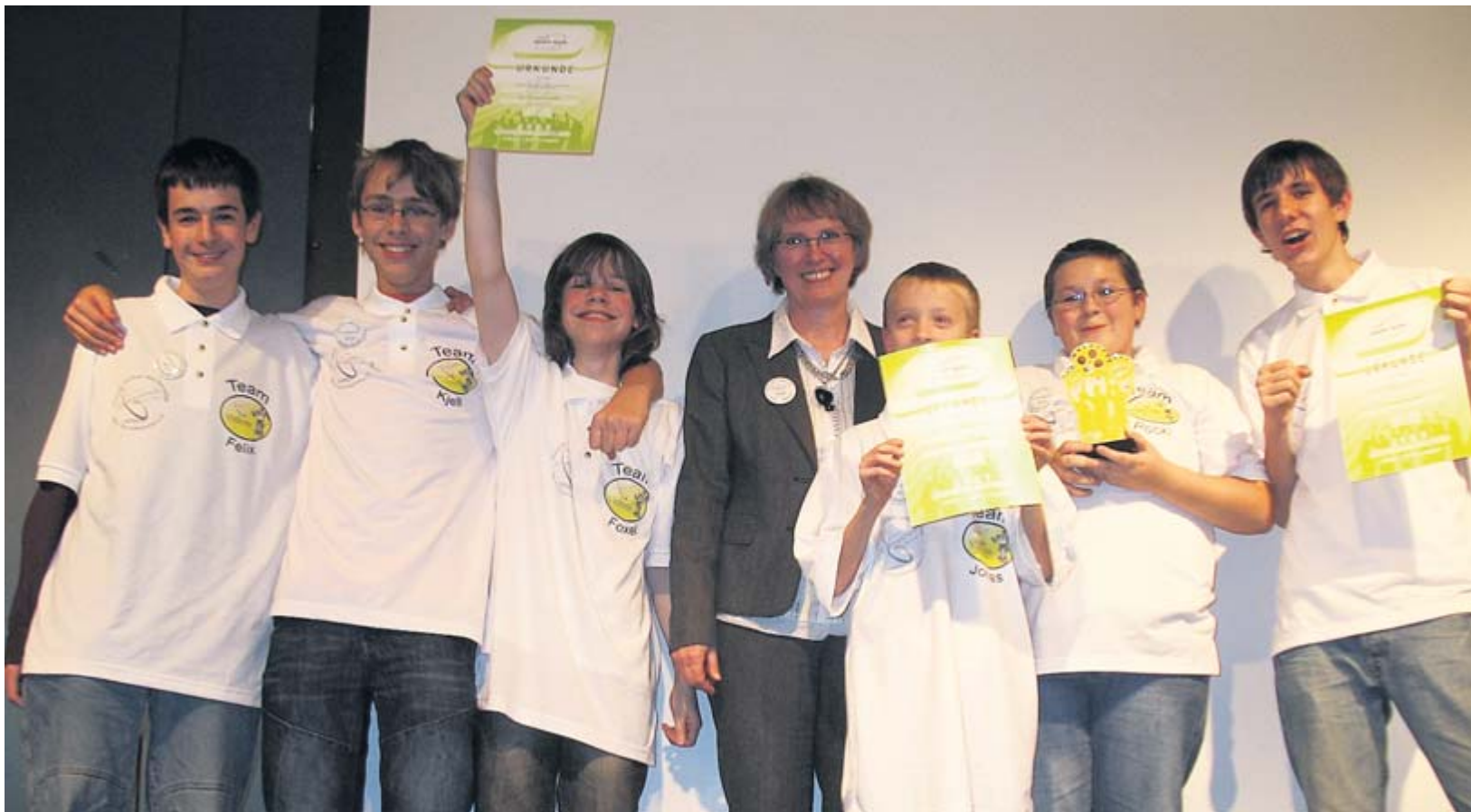
Voller Stolz präsentieren die siegreichen Teilnehmer des Lego-Roboter-Bauwettbewerbes, darunter auch Sankt-Viti-Schüler, ihre Urkunden.