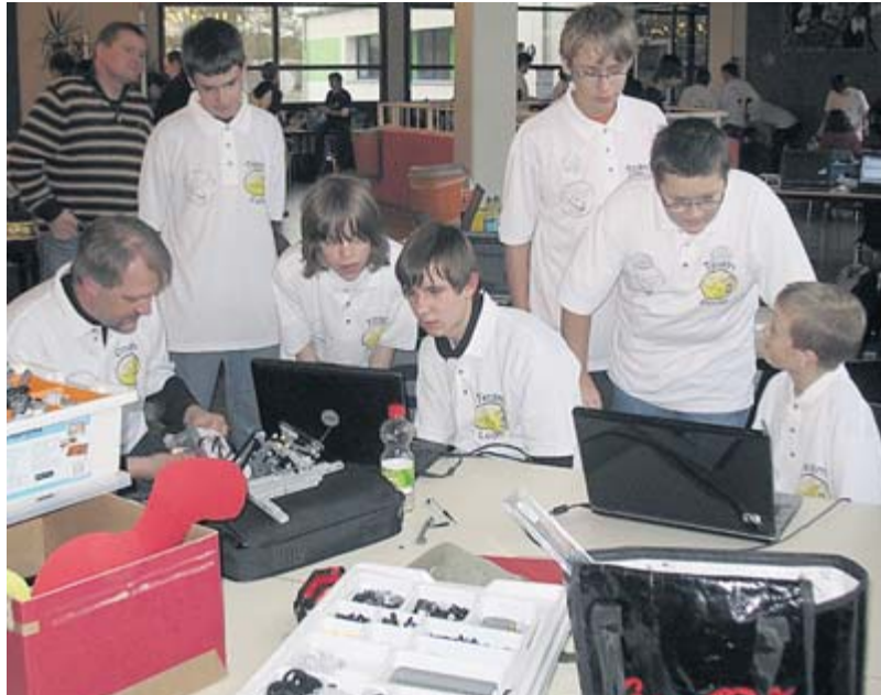
Emsig wird bis zum Schluss an den Robotern gebastelt.

wichtige Gründe: Die Programmierumgebung RoboLab zur Erstellung der Steuerprogramme für den Roboter arbeitet mit einer visuellen Programmiersprache, die einzelnen Anweisungen werden durch Symbole dargestellt. Nachdem das Steuerprogramm auf den Roboter übertragen wurde, führt der Roboter reale Aktionen durch. Dies ist für Schüler motivierender als virtuelle Aktionen auf dem Schirm. (js)